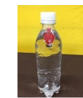
浮沈子 200円 (各回20名)