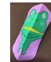
パックン人形 (かえる) 150円 (各回20名)