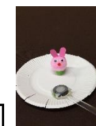
マグネット人形 (うさぎ) 150円 (各回20名)