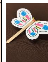
スポンジちょうちょ 150円 (各回20名)