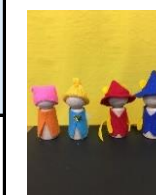
木の指人形2コ 800円 (各回6名)