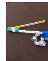
紙玉とぼし 200円 (各回20名)