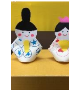
おひな飾り 100円 (各回20名)