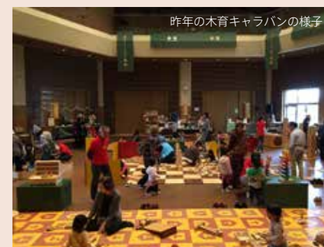
昨年の木育キャラバンの様子

おもちゃ学芸員資格を取得いただいた方には、鳥海山木のおもちゃ美術館の開館に向けたワークショップや、さらなるステップアップを目指したフォローアップ講座のご案内をさせていただきます。