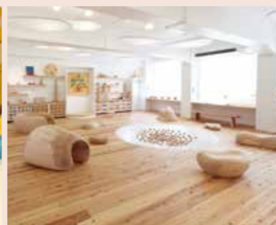
完成イメージ(例:東京おもちゃ美術館)