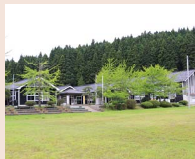
鳥海山木のおもちゃ美術館 外観

国登録有形文化財であり地域の方に長年愛され、守られ続けてきた「旧鮎川小学校」に、年間15万人の来場者を誇る「東京おもちゃ美術館」の全面監修のもと設立されます。館内には、地元産の木を使ったおもちゃや大型遊具を設置し、「子どもが楽しむための施設」というだけでなく市内の林業関係者や子育て支援団体の新たな活躍の場として子どもから大人までが楽しめる「多世代交流・木育美術館」とすることを目指しています。